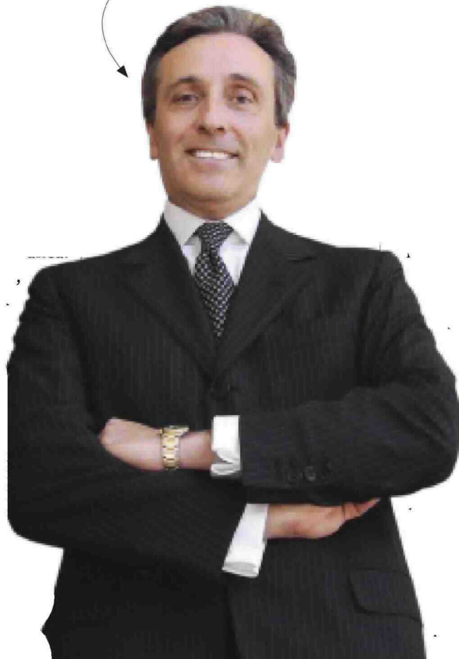
Vittorio Grilli L'ex ministro del Tesoro con gli investitori di Jp Morgan